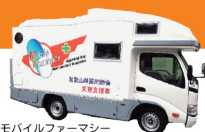
モバイルファーマシー